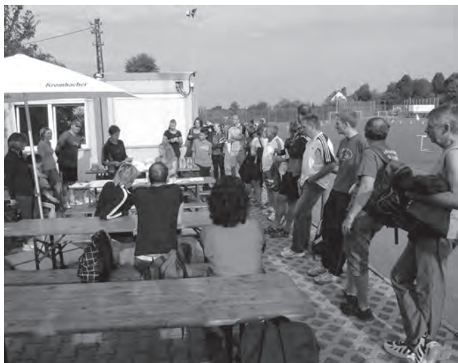
Kampfrichterbesprechung vor dem Wettkampf